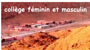
collège féminin et masculin