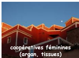
coopératives féminines (argan, tissus)