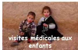
visites médicales aux enfants

l'école primaire essaadiyine du tiwadou accueille 122 élèves, et elle est subdivisée en trois sections situées dans les villages environnants; sur la route entre tiwadou et souk el hadd issi, se trouve le nouveau collège féminin et masculin, projet de mohamed