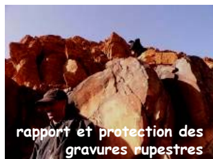
rapport et protection des gravures rupestres