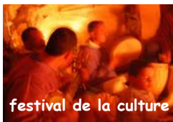
festival de la culture