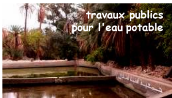
travaux publics pour l'eau potable